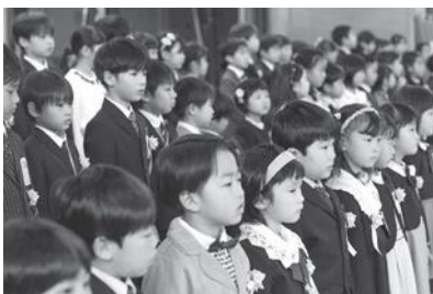
遊佐小学校入学式