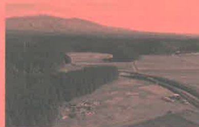
小山崎遺跡 遠景（吹浦地区）

その小山崎遺跡をたくさんの方に知っていただき、適切に後世に残すため、これから活用や保存の方針について有識者や地元の方と協議していきます。また、史跡指定を記念して鼎談を企画しておりましたが、新型コロナウイルス感染症拡大防止のため、残念ながら来年度に延期となりました。