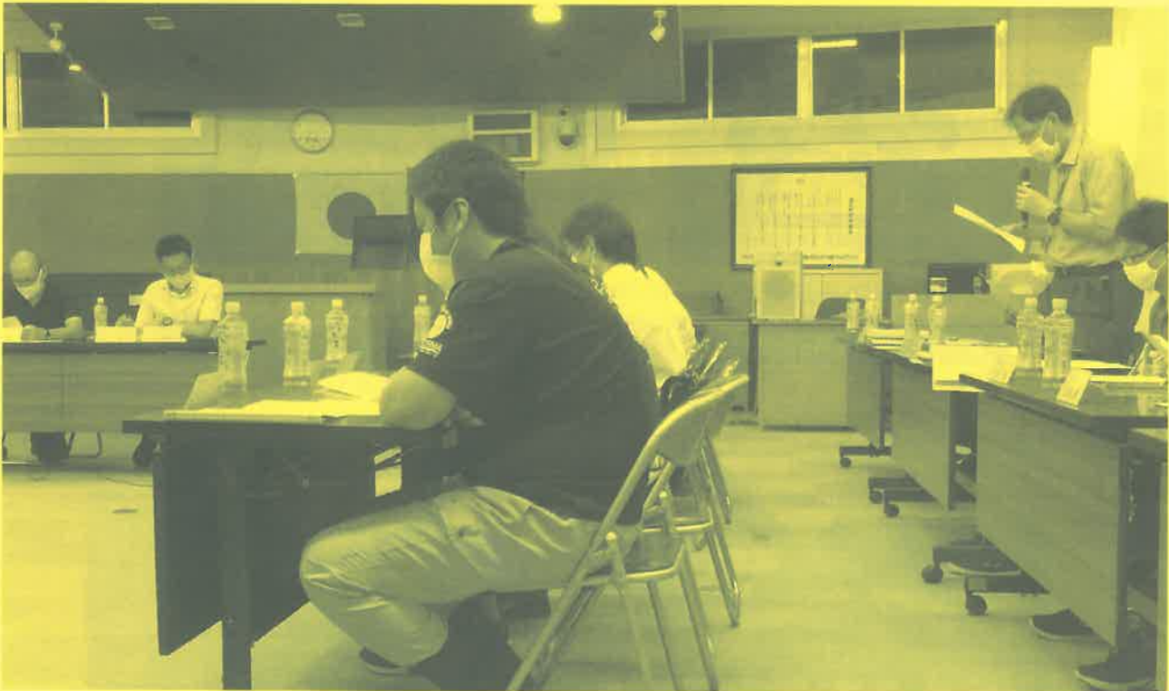
遊佐町立小学校新校開校準備委員会 理事会（令和2年9月4日開催）

交流学習（複数校の児童が一緒に学習すること）については、令和3年度から実施する予定です。実施にあたっては、今ある教育課程の中での実施、ねらいや目的の明確化、自然教室での交流、人間関係への配慮などの意見を考慮し、学校と協議しながら計画していきます。