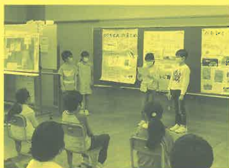
小学校のマスク着用の授業風景

また、新型コロナウイルス感染症対策のための国・県の取組みの一環として、各校にスクール・サポート・スタッフ1名ずつ、学習指導員1～2名ずつの配置が決まり、教員の多忙化の解消と、児童への支援の充実に効果が期待されます。