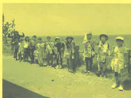
熱中症予防のためマスクをしない場合もあります