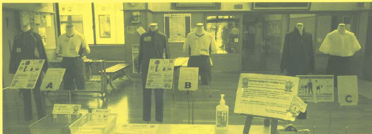
新体育着のサンプル展示

保護者の皆さまよりいただいたご意見は、新体育着の業者決定や細部調整の参考にさせていただきます、令和4年4月の着用開始をめざして協議を重ねていきます。