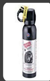
クマ撃退スプレー