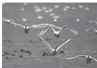
月光川河口の吹浦駅近傍にて 2025年2月

冬の朝、まだ空気が青く沈んでいる時間帯、ハクチョウのねぐらとなる水辺は最も美しい表情を見せます。冷えた空気が肌にやわらかくまとわりつき、霧の向こうから艶めかしい白が静かに浮かび上がる。 日の出を迎えると、白はほどけるように田んぼへ飛び立ちます。水面をすべる羽音、胸の奥まで冷やす吐息―その気配が、見る者の感覚をゆっくりに目覚めさせます。 北から渡ってきた彼らは、日中は水田で稲刈り後に残った落ち粃（米）をついばみまします。長い首を水と泥に差し入れ、粃を選り分ける仕草は、