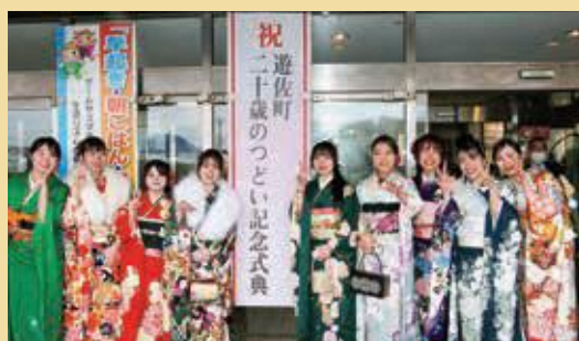
玄関前でパシャリ

1月11日、生涯学習センターにおいて記念式典が、パレス舞鶴において交流会が開催されました。久しぶりの再会に今年もたくさんの笑顔が溢れていました。