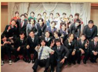
遊佐小学校卒業生