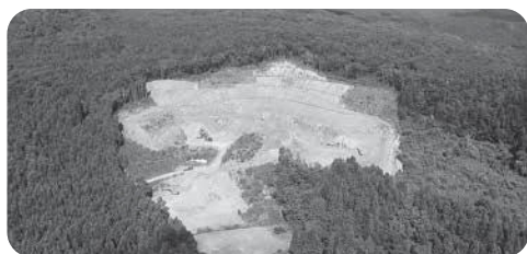
臂曲採石場全景（平成30年8月撮影）

※3月受理事前協議との主な変更点は以下のとおり ・事業区域内の採掘区域の変更(8,883㎡→7,889㎡) ・吉出山南麓湧水群の集水域に関する追加資料の添付