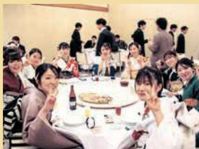
久しぶりの再会を楽しみました