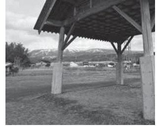
野沢の土俵からも良い景色