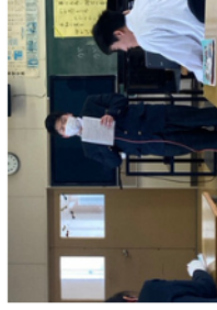
▼自分の好きな曲について解説する生徒