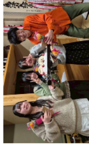
▼卒業祝い品とケーキをもらう寮生

そんな3年生の卒業報告会の様子が「遊佐高校魅力化【公式】」というYouTubeの「ライブ」というところから見られます！