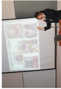
▼留学の説明をする生徒の様子

学校の下駄箱を通ってすぐのところに、なにやらかわいいうさぎ作品が！ 2年次生が「服飾手芸」の時間に作った作品たちでした。巾着やコースターなどが並んでいます。そういうえば、最近2年次生の教室に行くくと、休み時間に編み物している生徒がたくさんいたなあ。みんなこれを作っていたのか！と合点がいった朝でした。（下村）