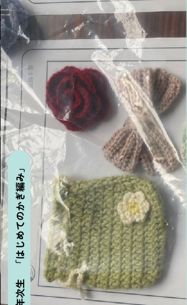
2年次生 「はじめてのかぎ編み」