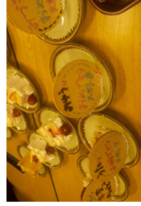
▼下級生が作ったケーキ