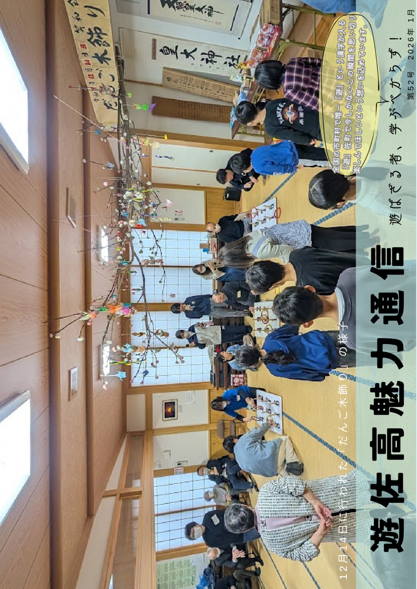
12月14日に行われた「だんご木飾り」の様子

全国の市町村で唯一「遊」という漢字が入る「遊」佐町で今しかないこの瞬間を思い切り楽しんでほしいという想いを込めています。