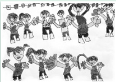
「うんどうかい たのしかったよ」