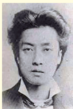
図版1 庄内藩主酒井忠篤肖像

と徳川慶喜のあと宗家を継いだ田安家の徳川家達が70万石の大名として駿河に引き移ったこと、鎮台府が鎮将府と改められ江戸城へは三条実美が入り、江戸が東京と