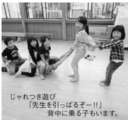
じゃれつき遊び 「先生を引っばるぞー!!」 背中に乗る子もいます。

中力が育つと言われています。実際にじゃれつき遊びの後の絵本タイムは、びっくりするくらい集中して聞き入っています。少し大きくなると体をいっぱい使った遊びも喜びます。お相撲ごっこや背中の上に乗っての電車ごっこも大好きです。体と体のぶつかり合いも経験しながら、相手のことを気遣う優しい気持ちも育っていきます。