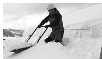
安全な雪下ろし作業例