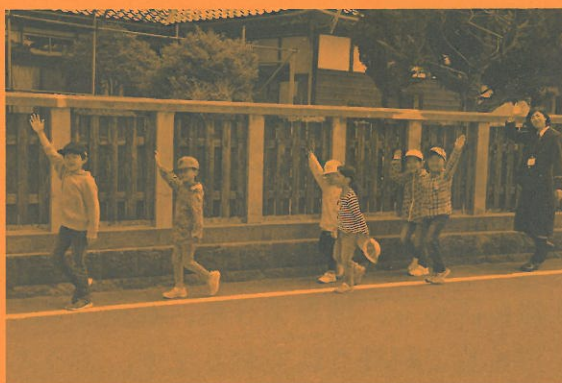
小学校での交通安全教室

登下校や地域での生活の安全を守ることを目的とした組織であり、地域の有志の皆様方からご協力いただいております。全国的にも児童の登下校時の安全確保が課題となっておりますが、遊佐町では地域毎に見守り活動の充実を図る取り組みが進んでおります。