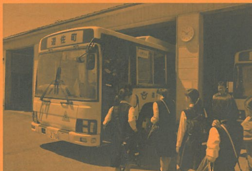
乗車人数確認のためのバス乗車試験

現在、遊佐中学校のスクールバスの利用は、夏期間は概ね4km以上、冬期間は概ね3km以上として運用しておりましたが、保護者の送り迎え等による中学校西側駐車場の混雑解消および、冬期間の風雪等から生徒の安全を確保するため、令和元年12月1日より、バス通学の対象範囲を、これまでの3km以上から1km以上に拡大して希望した生徒が利用します。