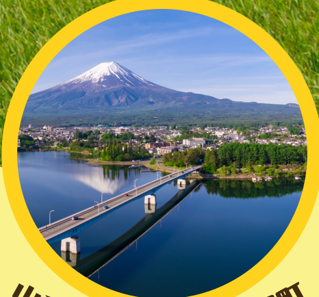
山梨県 富士河口湖町