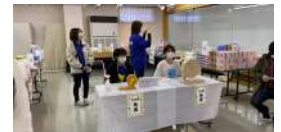
▲まるっと遊佐まつりも 初参加！抽選担当でした！

地域おこし協力隊になってからの半年、新しい経験をたくさんしました。初めての場所に行く、初めましての人に出会う、そこから繋がりが生まれる。そうやって自分の世界は広がるんだと改めて実感しました。