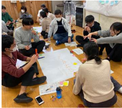
▲みんなで「私たち」の未来を考える