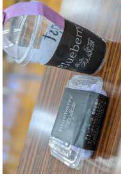
▲ ブラックシリーズ