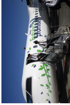
▲飛行機にワクワク！

(2年次担任・長尾先生より) 遊佐高校の2年生が京都と大阪に修学旅行に行きました。これまでコロナ禍で活動が制限されてきた生徒たちでしたが、その生徒たちの『初めて・久々』を一緒に体験でき、感慨深い気持ちでいっぱいです。 初めての飛行機、初めての関西、久々のバイキング、久々の楽しい会食等、生徒の嬉しそうな表情が忘れられません。