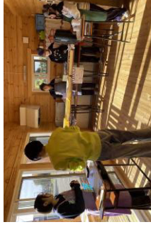
▲会計からお渡しまで生徒が担当 ▲あんバター×まるでタココス？