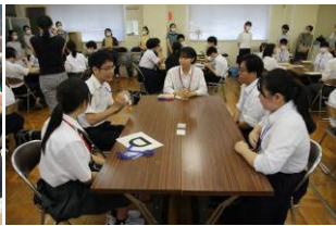
▲オープンスクールの様子