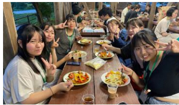
▲オリジナル遊佐カレー作り