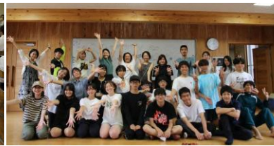
▲お別れ前に記念撮影