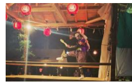
▲杉沢比山を皆で鑑賞