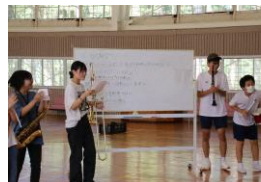
▲大活躍の遊佐中生4名