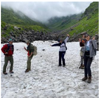
▲雪渓が残っていました

8/2に生徒、遊佐高の先生、ハウスマスターら計6名で鳥海山に登りました。天気にも恵まれ見事登頂です！生徒たちは弱音を吐かず最後まで登って降りきりました！大変だった分、きっと一生の思い出になりますね。下山後、鳥海山を眺めながら、「さっきまであそこにいたんだね」と感慨深そうに話していました。