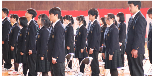
桜の花がまだ残る中、 24名が遊佐高校に入学しました。