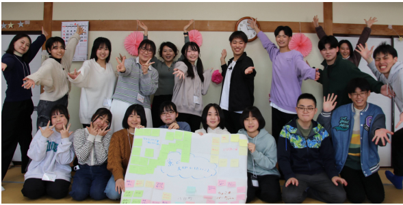
▲寮生活で大切にしたいことを話し合いました