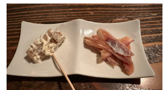
▲遊佐産の肴で飲むお酒、 美味しかった～(^^*)