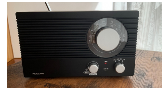
▲束の間の休憩に聞く、 お昼のラジオ番組が癒しになってます。