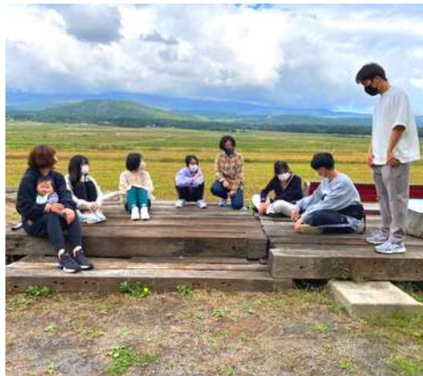
▲カフェ翠にて、対話の時間

10月は、県外の中学生向けの個別体験プログラムが行われました。合計8人の中学生が来てくれました。月光川で芋煮会をみんなでしたり、川ガニを砕いてガニ汁を作ったり、西浜でびしょ濡れになったりしました！中学3年生はとうとう受験。高校の3年間、どんな自分になりたいか、誰と何をしたいか、たくさん考えて、ワクワクしてください！