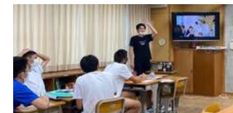
▲鮭に興奮する学生たち

せっかく授業できる機会ももらったからワークショップ型でやっとうと準備するも間に合わず、口だけの説明で中学生を置いてけぼりにした出前講座。