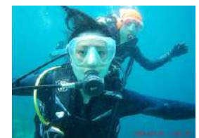
▲ダイビング中の写真

友だちに誘われてノリで取ることになったダイビングのライセンス。いざ潜るとなると怖すぎて、ずっとマスクとゴーグルを抑えなが泳ぐという必死さ。。