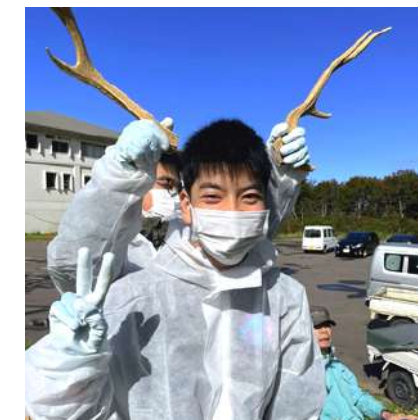
▲リアルせんとかん ※鹿の角は本物です！

みなさんが最近撮ったお気に入りの1枚はなんですか？鳥海山の写真？子どもの写真？10月から毎週金曜日に「わたしの1枚」を選んで留学生のみなんで共有しています。自分は何に心を動かすのか、心の声を聴きながら素敵な瞬間を共有しています。次はどんな写真をシェアしようかな～！