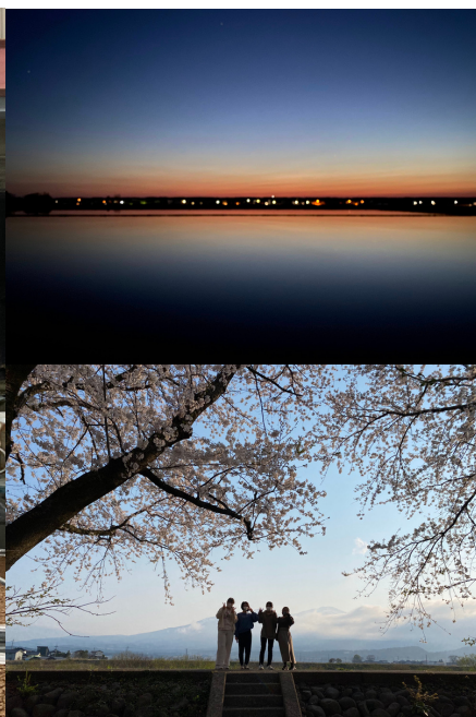
◀ 綺麗すぎて思わず撮影