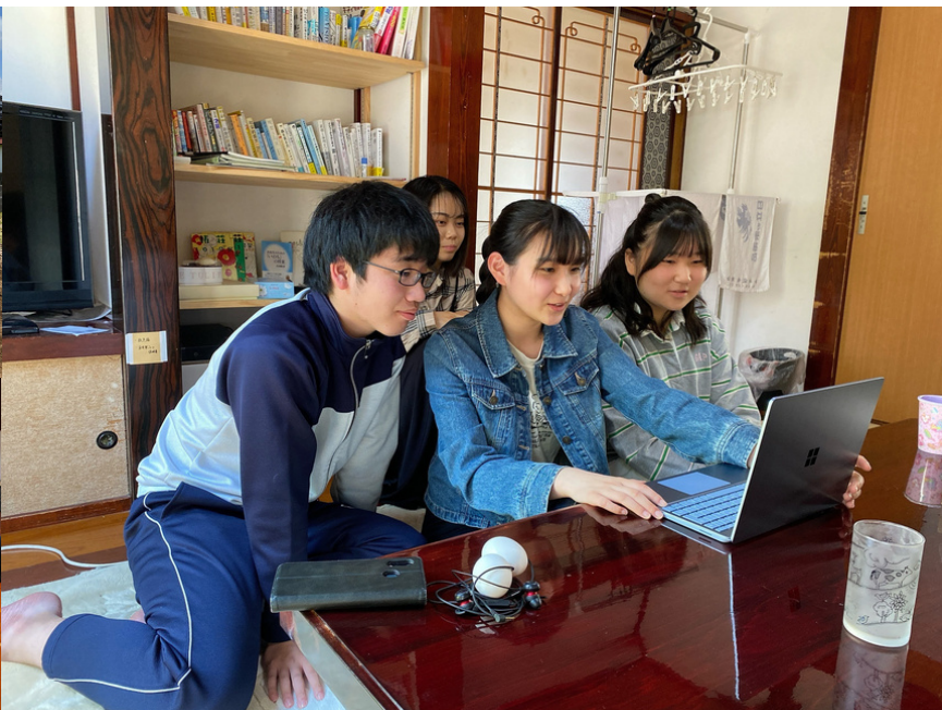
▲全国の高校が参加する「地域みらい留学」合同説明会 遊佐町・遊佐高の魅力を全国の中学生へプレゼン！