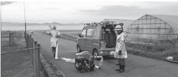
防ぎょ訓練の様子

町民の皆さまが消防団の活動に賛同し、消防団が存続できるよう参加・協力をお願いします。