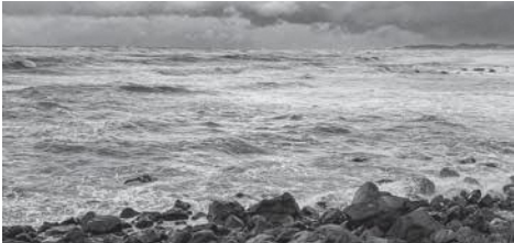
冬の日本海。インド亜大陸の衝突がもたらす景観です。

わっています。本来、ユーラシア大陸の中央から吹き出す冬の季節風は、日本列島だけでなく南のインド側にも吹き付けるはずですが。しかし、10,000m近い高さを誇るヒマラヤ山脈があるために季節風は南下できず、山にぶつかって東向きを変えます。この影響が日本列島にまで及び、冬に強い季節風が日本列島に長期間吹き続けるのです。同じ緯度で比較した場合、日本列島の日本海側だけ大量の雪が降るのはそのためです。冬の季節風の遠因となつていくヒマラヤ山脈は、およそ5000万年前から始まったインド亜大陸の衝突によって生じた山脈です。5000万年という年月が、今の冬の日本海側の景観をつくっています。