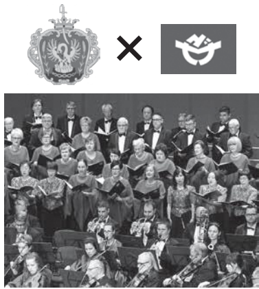
記念コンサートの様子

ソルノク市との交流は1983年に、ハンガリーの伝統舞踊を継承するティサ民族舞踊団一行49名を町連合青年団が受け入れたことから始まりました。そこから毎年、お互いの国を行き来しながら、2004年には姉妹都市協定が締結されました。同年、遊佐町合併50周年を記念して、ソルノク・コダーイ合唱団37名が来町してのフレンドシップコンサートが行われ、盛大に姉妹都市協定締結が祝われました。また、この交流をきっかけに町内でのパプリカの栽培が始まりました。ハンガリーは世界的に有名な産地として知られており、現地を訪れた農家が取り入れたものです。