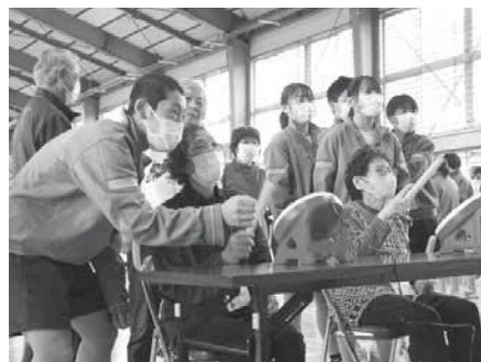
中学生が丁寧に教えてくれました!