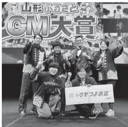
クセつよ賞を受賞！

遊佐町が賞を受賞するのは、3年ぶりです。6回目の受賞となります。今回の受賞により県内で年間150回の放送権を獲得しました。ぜひご覧ください。