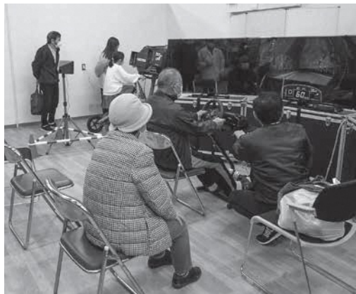
横断者には気をつけて…

11月13日、ショッピングセンターエルバにおいて、交通安全総合体験会が行われました。交通安全啓発活動として自動車や自転車、横断歩行の交通安全危険予測シミュレーターを気軽に体験することができ、約60人の方より体験いただきました。参加者からは「体験してよかった。これからも気を引き締めて運転していきたい」という声がかかれ、交通安全に対する意識の向上を図ることができました。