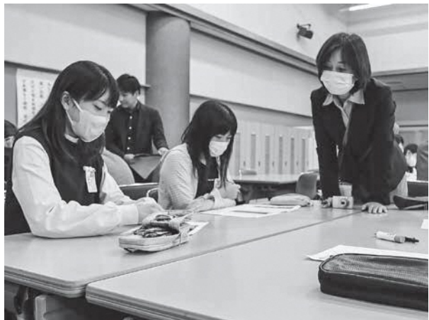
皆さん真剣にナレーションを考えています

11月24日、遊佐小学校6年生を対象としたメディアリテラシー講座が行われました。この講座はYTSが主催したもので、児童たちが地元の郷土遺跡である「小山崎遺跡」を知ることと、ナレーションにより情報の伝わり方の違いを学ぶことを目標としたものです。