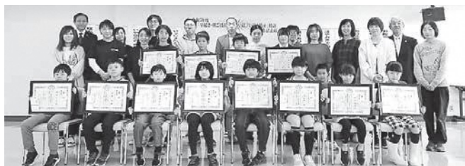
10月21日(土) 生涯学習センターでの表彰式の様子