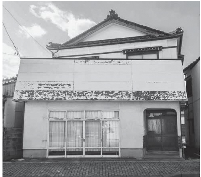
整備前の移住おためし住宅

「移住おためし住宅」は、遊佐町への移住やUターンを検討している方が使うことのできる、1棟貸しの住宅です。これまで広野集落にある1棟を運用してきましたが、より多くの方から町での暮らしを体験していただけるよう、駅前二区集落の空き家になった物件をお借りし、新たな移住おためし住宅を整備しています。