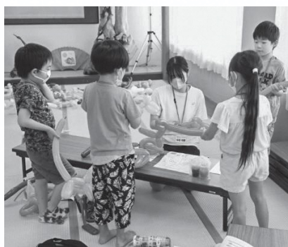
Yボラin庄内で子どもたちにバルーンアートを教えるメンバー

ここ数年は新型コロナウイルスの影響で、施設の高齢者や子どもたちとふれあひながら交流することが難しくなりました。そのため、「くじら」のメンバーで「どのようなボランティア活動が可能か」考えて、各施設の要望を伺い