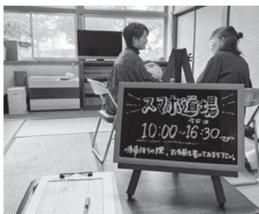
各地区でスマホ道場しています！ ぜひお越しください！！