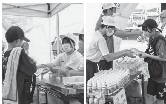
ソーデーマーチでゴールスタンプの押印や飲み物を手渡すメンバー