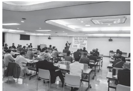
熱心に聞く参加者たち

そして、科学的な調査を長期にわたり実施して記録し続けること、調べた結果を理解し伝えていく環境学習を実施していくことが重要