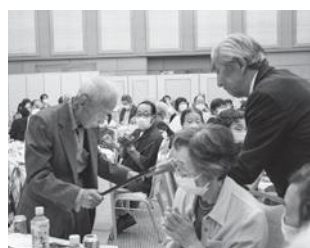
敬老者の状況 (令和5年9月1日現在)