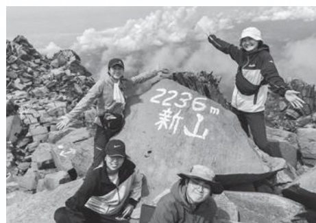
念願の登頂！任期中にあと何回登れるか…。

「遊ばざる者 学ぶべからず」 「遊ばざる者 働くべからず」 「遊」の漢字が入る遊佐町で遊びましょう！！