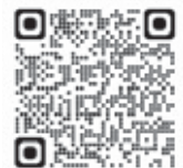
▲酒田市ホームページ