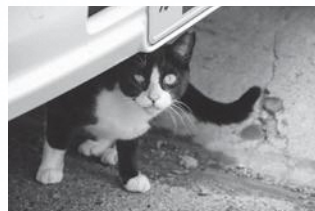
遊佐の隠れた魅力!? 会える猫たちが可愛い。