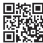
▲庄内観光コンベンション協会 ホームページ

天候などの理由により寄港が中止となった場合は、「庄内観光コンベンション協会」ホームページ及び「酒田市」ホームページに情報を掲載します。