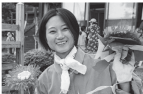
吹浦祭にて花笠の花をゲット！

高校生たちとこういうことが一緒にしたい！手伝ってほしい！などがありましたらご連絡お待ちしております！