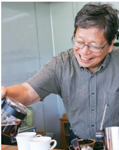
「ここは夢を語れる場所」