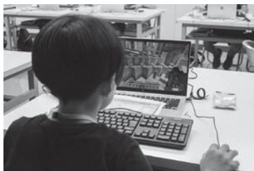
遊佐町初のマイクラフト教室！