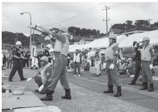
救命索発射器操法の様子

9月16日、鶴岡市の由良漁港において、山形県合同海難救助訓練が行われました。この訓練は5年に一度、県内で発生する海難事故への迅速な対応を図るため県水難救済会が主催しており、所属する県内の11救難所が参加し、救難技術研修や救難技術競技や海上保安庁や消防本部などと連携した総合