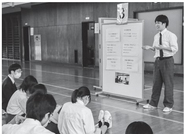
自分で作成したスライドを使っでの発表です

子どもたちは、自在に泳ぎ回る魚たちに「私の描いたお魚さんだ!」などと歓声を上げ、その姿を追いかけました。