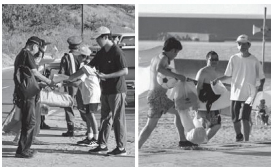
夕日まつりで来場者にチラシを配布するメンバー

発足は平成9年4月1日。町の中学生と高校生がボランティア活動を始めました。20年以上の歴史があり、途中から隣の酒田市に在住する高校生も含めて、ボランティアサークル「くじら」として活動しています。生徒たちは「社会のために役に立ちたい、町のために少しでも貢献したい」という思いを持って活動しており、活動を知る方々から賞賛の声をいただいています。