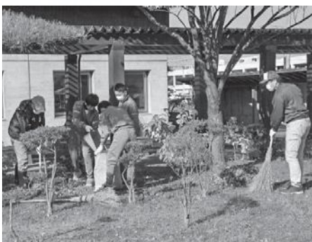
昨年度、図書館の落ち葉拾いを自治会役員さんと一緒に活動するメンバー

「くじら」の活動について認知度が上がり、ロードレース大会や各地区のまちづくり協議会主催「防災訓練」のスタッフ補助などに声がかかるようになってきました。その他にも、防砂林の枝打ち作業など、多方面で活動の機会が増えています。また、「くじら」の活動を聞いて青少年育成推進員の方々や、各自治会の皆さんが、「生徒の頑張りをぜひ応援したい」と、生徒たちと一緒に清掃をしてくださっています。