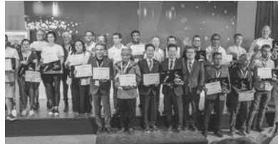
2020年～2023年に新規認定されたユネスコ世界ジオパークの認定証を手に、喜びを分かち合う大会参加者

残念ながら、9月8日に発生した大きな地震により、大会の一部や、アフリカ初のユネスコ世界ジオパークであるムゴウンユネスコ世界ジオパークの現地見学は中止となっていました。また、このように、世界大会に参加し、大会参加者に鳥海山・飛鳥ジオパークの存在を示すことは、ユネスコ世界ジオパークの認定を目指すうえで重要です。