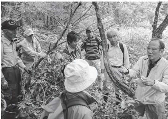
湿地帯の現地調査

であり、水温計で湧水の水温を定期的に測って記録していくだけでも科学的な調査となることを学びました。今後は、町全体で健全な水循環について学んでいけるよう事業を推進していきます。