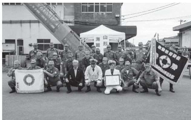
2連覇を達成しました

海難救助訓練などを行うものです。大会当日は県内の11救難所から約300人の救助員が参加し、町からは吹浦救難所と西遊佐救難所の計43名が参加しました。