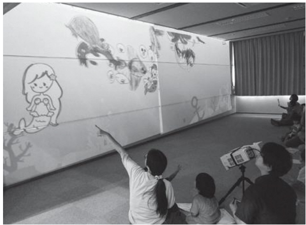
自分の描いた魚が壁に出現します

9月17日～18日の期間、子どもセンターにおいて、酒田光陵高校 I Tサイエンス部の皆さんのご協力で「バーチャル水族館」が行われました。「バーチャル水族館」は2016年から始まったもので、スクャナーで取り込んだ絵画をパソコンで編集し、プロジェクターで壁などに投影するものです。