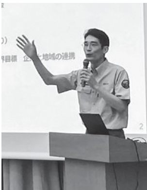
羽井佐氏の基調講演の様子

8月26日、27日、「鳥海山SEA TO SUMMIT 2023」が行われました。「SEA TO SUMMIT」はカヤック・バイク・ハイクの3種類のアクティビティを行い、海から山頂を目指す環境スポーツイベントです。1日目は、羽井佐幸宏氏（東北地方環境事務所統括自然保護企画官兼次長）による基調講演が行われ、自然環境保全活動についてお話しいただきました。