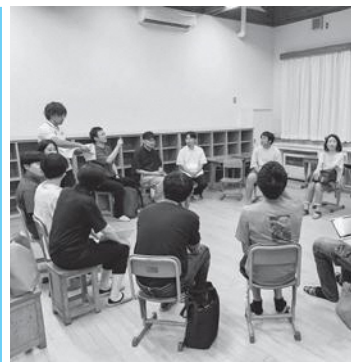
旧高瀬小学校でのワークショップの様子