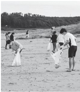
早朝からお疲れ様でした

この活動は、豊かで美しい庄内海岸を未来に引き継いでいくために職員に呼びかけ実施したものです。今後も様々な地域貢献活動を継続して実施していきます。