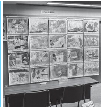
作品への思いが 伝わってくるようでした

われました。町内の保育園と幼稚園の年長児が自分の好きな絵本の世界を画用紙いっぱい描きました。どの作品も作者の個性が出た素敵な作品になりました。