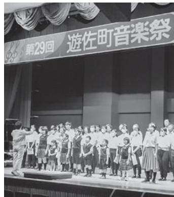
4年ぶりの合同演奏

8月20日、生涯学習センターにおいて、第29回遊佐町音楽祭が行われました。今年度の音楽祭は3個人6団体の音楽愛好家が参加。合唱、吹奏楽、ギターからヴァイオリン、サクソフーン、ハーモニカまで、幅広いジャンルの演奏を披露しました。最後はみんなで合同演奏。出演者参加者問わず、「ふるさと」を合唱しました。