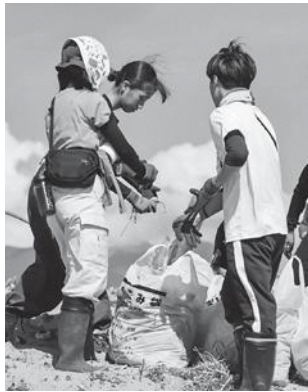
若い力が美しい海を守ります

8月29日～9月2日の期間、庄内各所において、NPO法人国際ボランティア学生協会 (IVUSA) とNPO法人パートナーシップオフィスによる海岸清掃が行われました。この活動は、海岸の清掃活動を通じ、県内外の大学生が海洋ごみの実態について理解を深めるものです。当日は約100名の参加者が西浜海岸を中心に清掃。町からは学生の皆さんに野外炊飯で使用してもらったため、遊佐カレーの素を贈呈させていただきました。IVUSAとパートナーシップの皆さん、ありがとうございました。