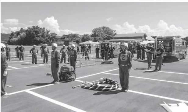
消防操法審査会の様子

私たちは、団員の質の向上と育成に重点を置いた訓練等を計画して取り組んでいます。今年度は、分団一丸となって消防団活動の基本である火災現場での消防技術の習得と、指導体制の確立を目的として、「消防操法」を実践しています。8月20日には分団で初となる「消防操法審査会」を開催し、訓練を通じた習得技術の確認を行いました。