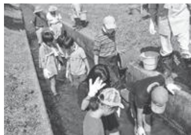
一生懸命、魚を追いかけています