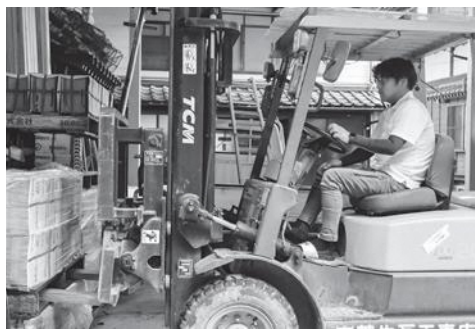
フォークリフトで作業中の様子