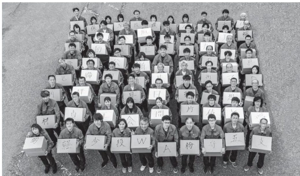
ドローンを使っでの撮影