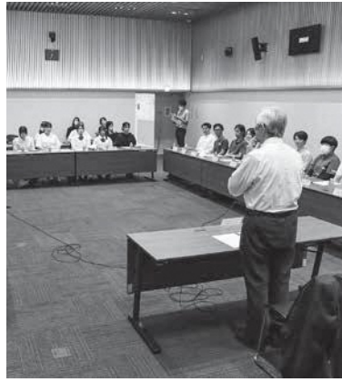
町を明るくする若者大集合です！