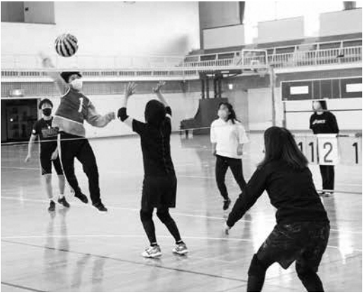
「遊's」は様々なスポーツ事業を主催しています

A 少子化・部活動適正規模を考慮し、学校での部活動指導員というものを、現在町内では12名配置しています。部活動指導員には報酬を支払って