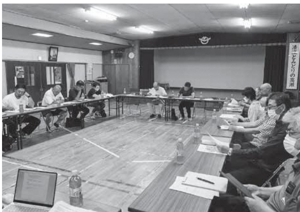
令和6年度の完成を目指します

7月5日・6日、高瀬地区と蔵岡地区でまちづくりセンターを旧小學校へ移転改築するための検討会議が行われました。会議には各地区の検討委員や町の担当者、設計業者が参加し、旧小學校の各部屋をどのように使用するなどを協議しました。今後検討会議を重ね改築内容を決定し、令和6年度に改築工事を予定しています。