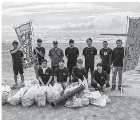
綺麗な海を目指して

7月9日、遊佐町商工会青年部 が西浜海水浴場において、”絆”感 謝運動として海岸清掃を行いました。