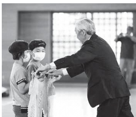
緑の少年団の仲間入りです