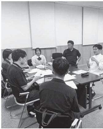
会場を移動してのグループワーク

6月28日、役場において、若者を中心としたビジネス創出事業構想会議が行われました。 「若者を中心としたビジネス創出事業」は今年度、若者が町に集い、働く仕組みを将来に向けて築いていくために新しく立ち上げたものです。立ち上げのきっかけは、昨年10月から町内外の若者や高校生が参加したWAGAZEMI（ワガゼミ）と呼ばれるワークショップです。WAGAZEとは庄内弁で若い衆、仕事の前線で活躍する若者を意味します。そのWAGAZEが集い、町の課題についてワークショップを