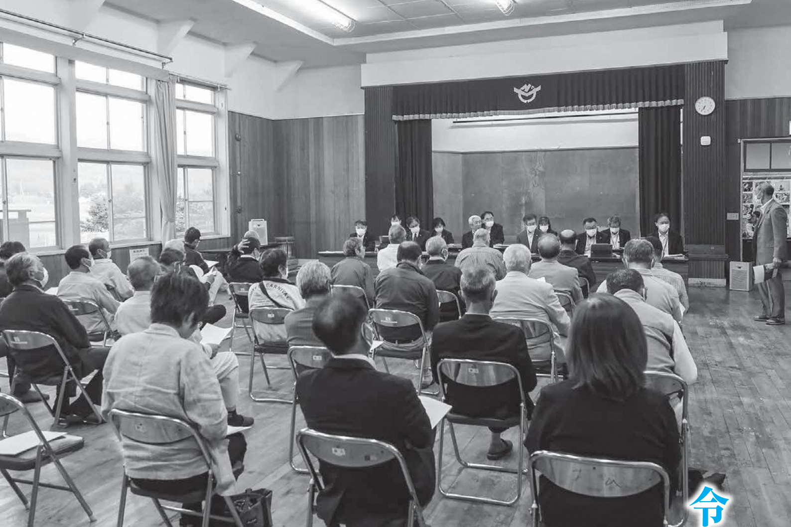
蕨岡地区町政座談会（蕨岡まちづくりセンター）