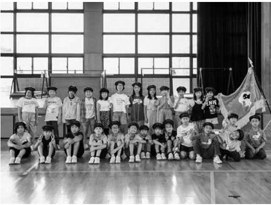
遊佐小学校では緑の少年団を結成しています

Q 令和3年3月に保安林の伐採があった。県では1,500本植林することで同意したが、ほとんど進んでいない。役場として、保安林に対してどう思っているのか。また、県に対してどう働きかけていく考えなのか伺いたい。