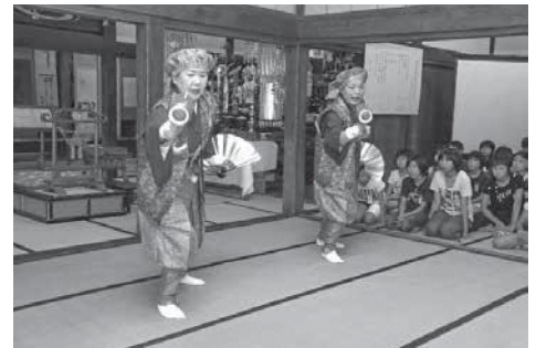
戴邦碑祭の様子(おすわり大黒舞)