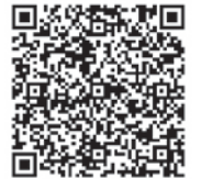
▲町ホームページ (水循環保全)