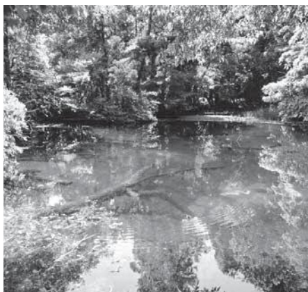
周辺整備が求められる丸池様

ら課題となっていますが、水洗を考えたときに、水や電気の問題があり適に使用していただけるものにしてほしいと思います。もう少し時間をいただきたいと考えています。環境整備についても、地域の方の協力を得ながら検討していきます。牛渡川沿いの草刈りについては、年に1度町の事業で行っていることをご理解いただきたいと思います。