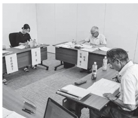
事業事業ヒアリングの様子

7月6日・7日、役場において、 行政評価外部評価ヒアリングを行 いました。町が昨年度行った様々 な事務事業について、課題の整理 や事業の成果を検証し、町民視点 での町政運営を目指すことを目的