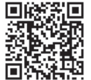
▲水の日・水の週間 ホームページ