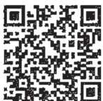
▲国税庁ホームページ