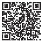
▲動画で見る確定申告