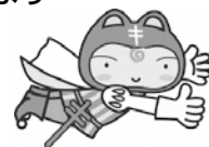
「結核と戦うシールぼうや」