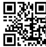
▲IJUターン促進協議会のホームページ

● 応募先・問 ／町IJUターン促進協議会事務局（企画課定住促進係内）☎28-8257