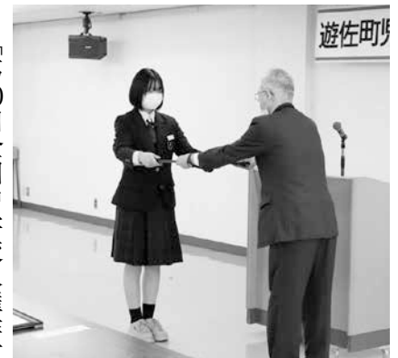
今年の活動が評価