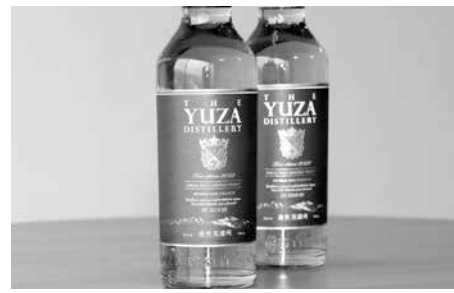
YUZA シングルモルト ジャパニーズウイスキー ファーストエディション2022