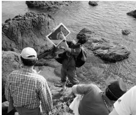
ガイドの会で案内する様子

でもそんな時代だからこそ、現地に行って直接体験してみたいという欲求が強くなっていると感じます。湧水に足を浸してみたい。