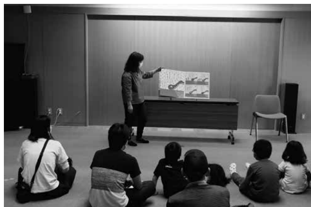
図書館での読みきかせ

「心豊かにいのち輝く町民の育成」29回目となる「奥の細道鳥海ツアーデーマーチ」は、新型コロナウイルスの感染状況を考慮しながら、より魅力あるウォーキング大会となるよう内容の充実に努めます。