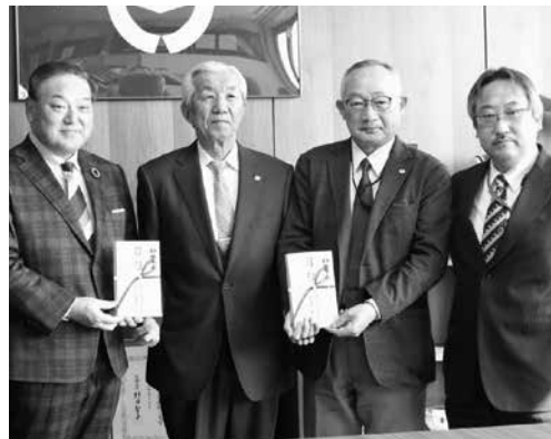
ありがとうございました

両社は十里塚・白木にある8基の風力発電機の管理運営を行っている会社で、町の環境保全活動に役立ててほしいと寄付をいただきました。いただいたお金は環境保全基金に積み立てます。