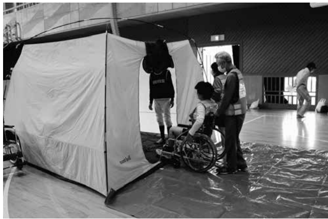
万が一の為に防災訓練（遊佐中学校）

防災について、情報発信の多重化を図るための新たなツール導入の検討、避難所での新型コロナウイルス感染症防止対策のための物品を含む資機材・備