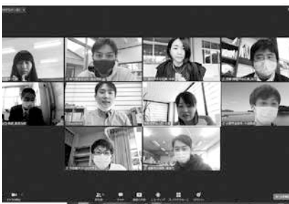
遊佐の暮らしを他地域に話しています！

遊佐町に来て3年目、知らないことばかり。今この文章を読んでもう一度読んでくださっているまだ出会っていない皆さんともお話したいです。