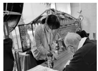
新型コロナウイルスワクチン接種会場での出張申請コーナーの様子