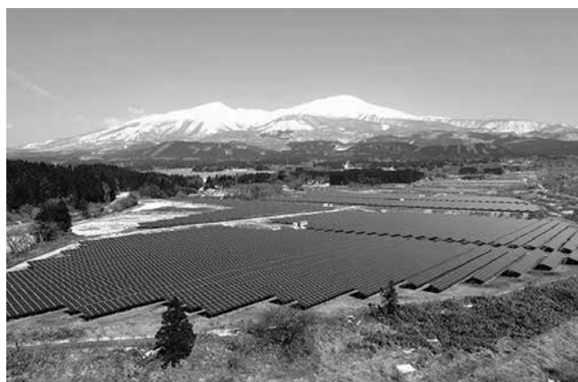
庄内遊佐太陽光発電所

また、「庄内・遊佐太陽光発電所」の収益の一部を活用して酒田市に設置された庄内自然エネルギー発電基金について、基金活用に係る協議会の運営を通して、庄内地域の持続可能な社会づくりに寄与し、「地域循環共生圏」ローカルSDGsの実現に向けて努力します。