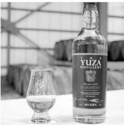
遊佐蒸溜所ウイスキー (株金龍)

鳥海南工業団地において、鳥海南バイオマス発電所の建設が進んでおり、雇用の創出と拡大が期待されています。また、平成30年に竣工した金龍ウイスキー遊佐蒸溜所で、第1号となるウイスキー「YUZA First edition 2022」が発売されました。今後も、地域の特性を活かして、企業誘致を推進していきます。 就労環境については、関係組織と協力し、町内企業と求職者のマッチングを図ります。