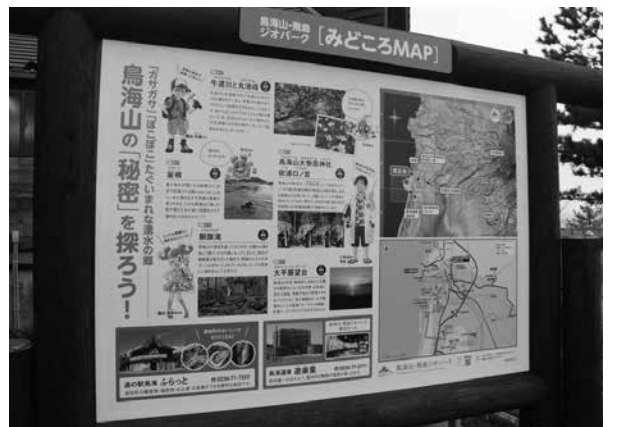
ジオパーク案内看板（十六羅漢）

日本海沿岸東北自動車道について、一日も早い全線開通に向けた要望活動とともに、地域に豊かさをもたらす遊佐パーキングエリアタウンの整備に向けた取り組みを進めます。