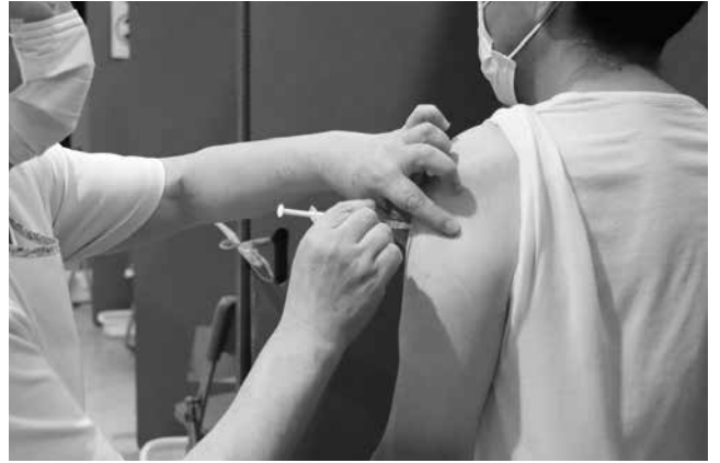
新型コロナワクチン接種

給付費の増加により厳しい財政状況にあるため、国民健康保険税の適正な算定をおこない安定的な制度運営に努めます。