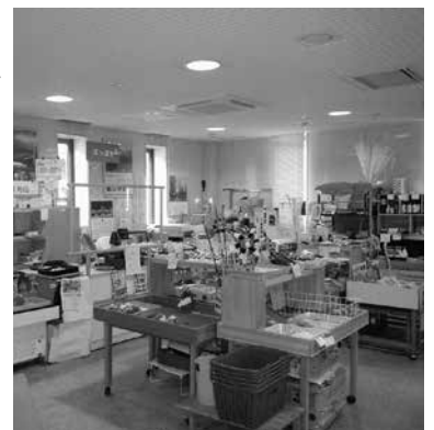
E-Bikeが設置される予定です

JR遊佐駅構内(ゆざつとプラザ)にある農産物直売所「ぼっぼや」が3月25日(金)に閉店しました。同店は「遊佐駅前賑わい再生事業」の一環として平成20年から14年間にわたり、遊佐町特産品・新鮮野