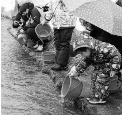
また帰ってきてね

2月27日(日)、榊川鮭人工孵化場において、遊佐で遊ぶ会「鮭稚魚放流会」が開催されました。NP Oいなか暮らし遊佐応援団が、町に移住してきた方を対象に、遊佐の魅力を発見し、移住者同士の輪を作ると同時に、遊佐での暮らしを知って楽しんでもらうため毎年