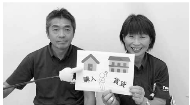
空き家情報は私たちまでお願いします