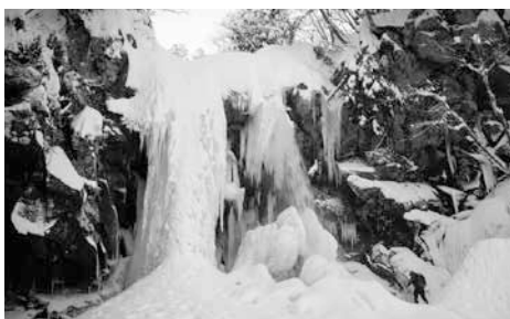
今年1月、二ノ滝周辺へ注意喚起の看板設置に同行した際の写真

二ノ滝氷柱だけではなく、身近なところにあちこちあふれる自然の造形美。二度と同じ形になる事は無い自然の「アート」を、これから見つけたら写真という「形」に残していきたいと思えます。