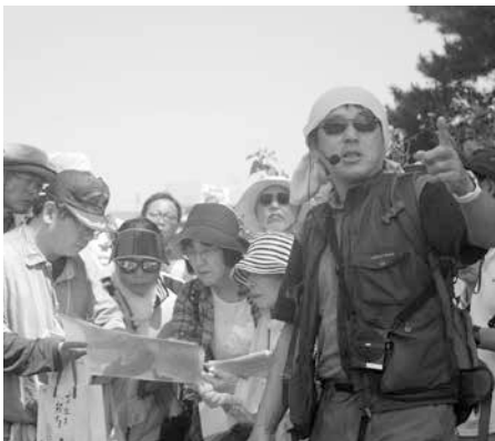
ガイド養成講座で指導する様子

鳥海山・飛鳥ジオパークの子どもたちには、ぜひふるさとを作った「地球の秘密」について学んで欲しいと思います。