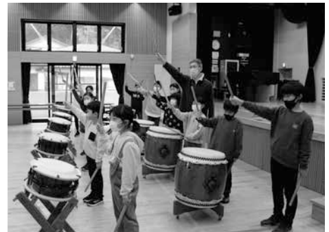
ヤー!! 憧れの6年生に一步近づけましたね☆