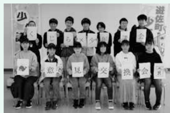
くじらと少年議会の集合写真