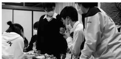
遊佐丸と米〜ちゃんせんべい試食