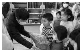
施設への寄贈の様子

今年度で19期目を迎える遊佐町少年議会は、少年町長(1名)・少年副町長(1名)・少年議員(10名)の計12名で活動してきました。当選した昨年6月から12月まで、学業・受験・部活動との両立を図りながら、町の事を考え一生懸命活動しました。活動を締めくくり主な活動を紹介いたします。