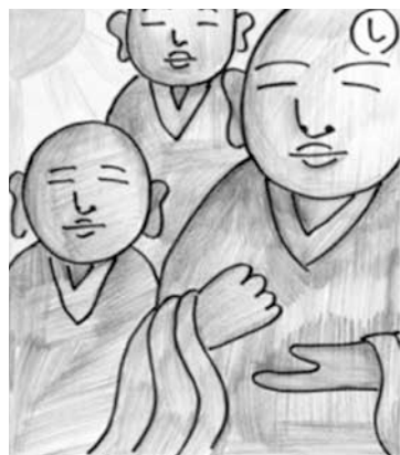
「し」十六羅漢の仏の顔全部見つけられるかな