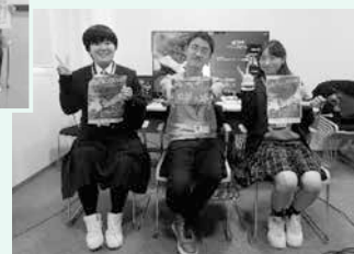
若者サミットへのオンライン参加