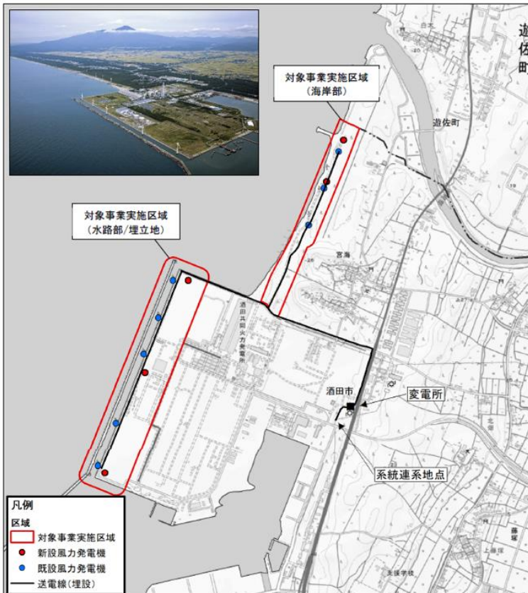
対象事業実施区域等