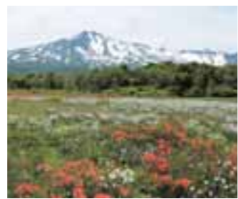
3 薬ノ木台湿原 (秋田県)