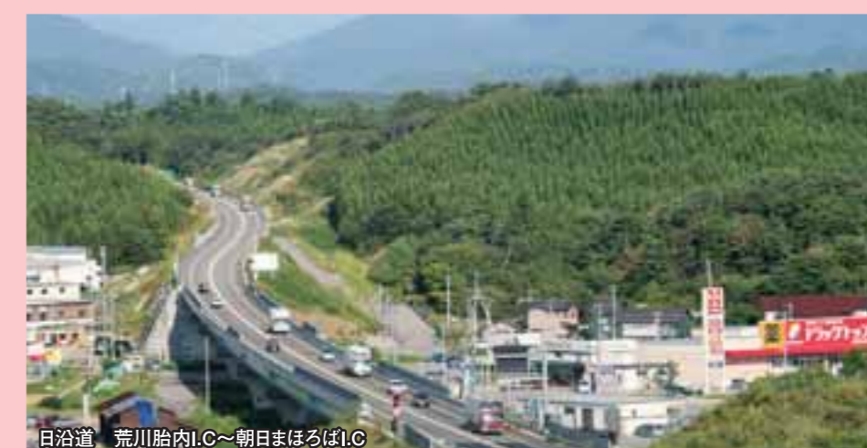
日沿道 荒川胎内I.C.~朝日まほろばI.C.