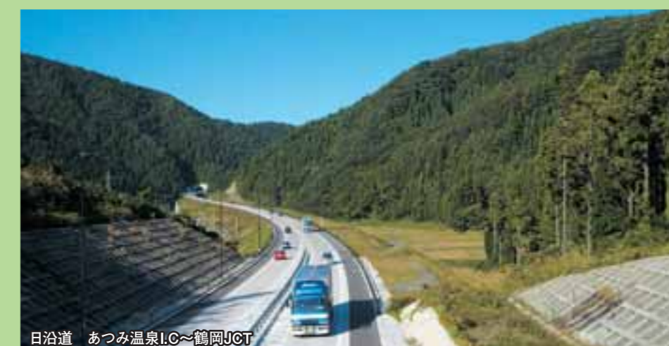
日沿道 あつみ温泉I.C.~鶴岡JCT