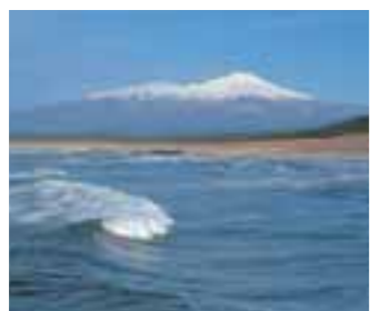
5 鳥海山 (山形県)