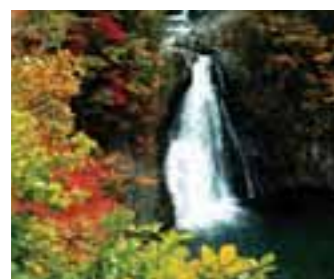
1 法体の滝 (秋田県)

観光による秋田・山形・新潟県の一体的広域圏が形成されます 充実した観光が構築されます