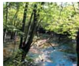
4 獅子ヶ鼻湿原 (秋田県)