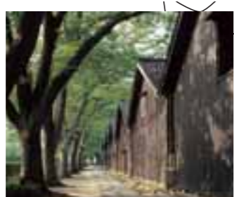
6 山居倉庫 (山形県)