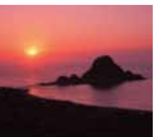
8 日本海の夕日 (山形県)