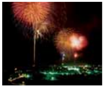
2 日本海花火フェスティバル in 象潟 (秋田県)