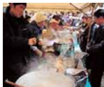
7 寒鱈まつり (山形県)