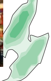
13 新発田市 (新潟県)