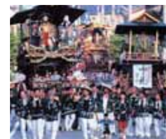
10 村上大祭 (新潟県)