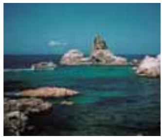
9 笹川流れ (新潟県)