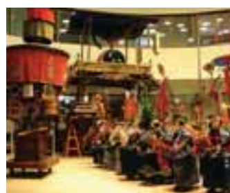
12 おしやぎり会館 (新潟県)