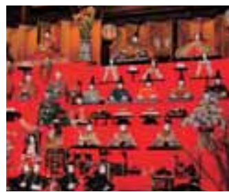
11 城下町村上上町屋の人形さま巡り (新潟県)